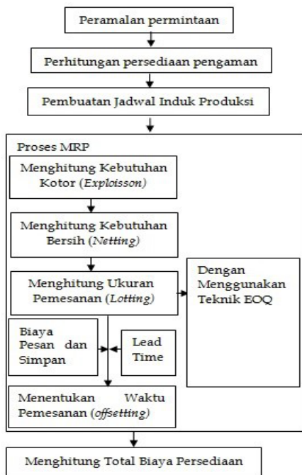
Gambar 1. Bagan alur analisa data

Penentuan waktu pemesanan juga dilakukan untuk menentukan saat yang tepat untuk melakukan rencana pemesanan berdasarkan kebutuhan bersih dengan cara mengurangi saat awal tersedianya ukuran lot yang diinginkan dengan besarnya lead time . Setelah melakukan proses MRP, maka selanjutnya membuat tabel MRP yang ditampilkan pada Tabel 1.